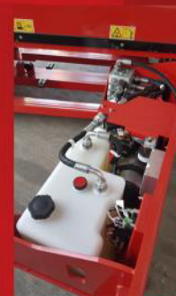
Gabinete sistema hidráulico